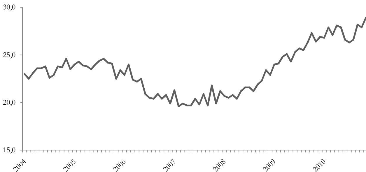
Graf. 1– Andamento della disoccupazione giovanile (15-24 anni) 2004-2010 (dati destagionalizzati)

Fonte: Istat, Rilevazione continua sulle forze di lavoro (stime mensili)